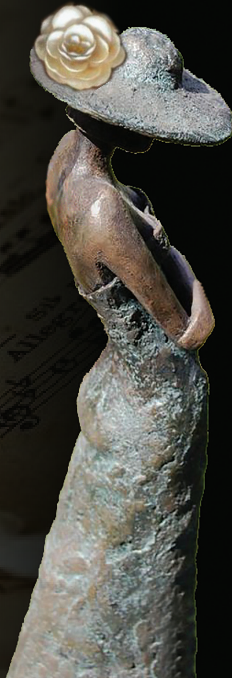
'I Love You (Lovely Female Girl Standing With A Hat sculpture)' by Kay Singla